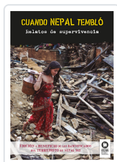
CUANDO NEPAL TEMBLÓ VARIOS AUTORES