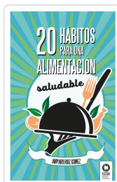
20 HÁBITOS PARA UNA ALIMENTACIÓN SALUDABLE RUIZ GÓMEZ, AMPARO