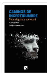
CAMINOS DE INCERTIDUMBRE PRADA, ALBINO