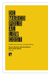
DE MARCO POLO AL LOW COST MARTÍNEZ SÁNCHEZ-MATEOS, HÉCTOR/RUBIO MARTÍN, MARÍA