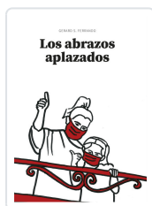
LOS ABRAZOS APLAZADOS S. FERRANDO, GERARD