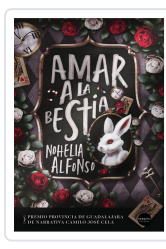
AMAR A LA BESTIA ALFONSO, NOHELIA