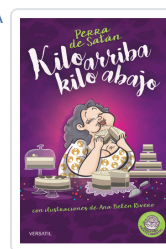
PERRA DE SATÁN, KILO ARRIBA, KILO ABAJO PERRADESATÁN