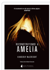
RECONSTRUYENDO A AMELIA MCCREIGHT, KIMBERLY