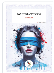
NO ESTABAN TODOS NEGRE, EMI