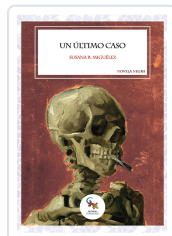
UN ÚLTIMO CASO R. MIGÚELEZ, SUSANA