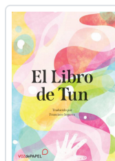
EL LIBRO DE TUN SEGARRA, FRANCISCO