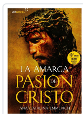
LA AMARGA PASION DE CRISTO (14ª ED.) ANA CATALINA EMMERICH