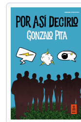
POR ASÍ DECIRLO PITA, GONZALO