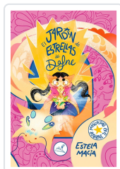
EL JARDIN DE ESTRELLAS DE DAFNE MACIA, ESTELA