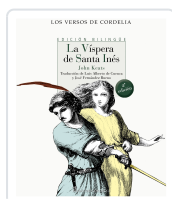
LA VÍSPERA DE SANTA INÉS KEATS, JOHN