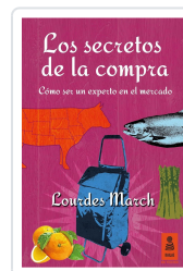
LOS SECRETOS DE LA COMPRA MARCH FERRER, LOURDES