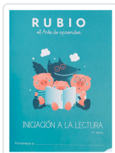
INICIACIÓN A LA LECTURA RUBIO +4 VARIOS AUTORES