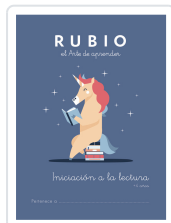
INICIACIÓN A LA LECTURA RUBIO +4 VARIOS AUTORES