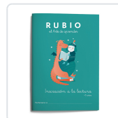
INICIACIÓN A LA LECTURA RUBIO +5 VARIOS AUTORES