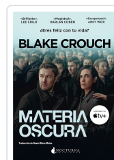
MATERIA OSCURA CROUCH, BLAKE