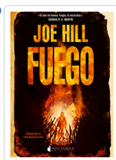
FUEGO HILL, JOE