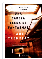
UNA CABEZA LLENA DE FANTASMAS TREMBLAY, PAUL