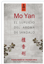
EL SUPICIO DEL AROMA DE SÁNDALO (3ª ED.) YAN, MO