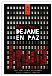
DÉJAME EN PAZ XUECUN, MURONG