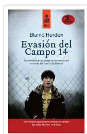
EVASIÓN DEL CAMPO 14 (5ª ED.) HARDEN, BLAINE