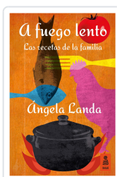
A FUEGO LENTO LANDA APARICIO, ÁNGELA