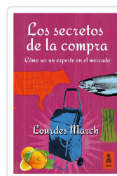
LOS SECRETOS DE LA COMPRA MARCH FERRER, LOURDES