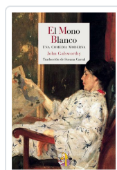
EL MONO BLANCO GALSWORTHY, JOHN