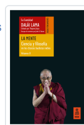
LA MENTE (CIENCIA Y FILOSOFÍA EN LOS CLÁSICOS BUDISTAS INDIOS, VOL. II) LAMA, DALÁI