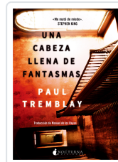
UNA CABEZA LLENA DE FANTASMAS TREMBLAY, PAUL