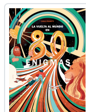
LA VUELTA AL MUNDO EN 80 ENIGMAS FRABETTI, CARLO