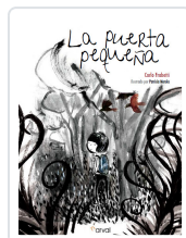
LA PUERTA PEQUEÑA FRABETTI, CARLO