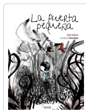
LA PUERTA PEQUEÑA FRABETTI, CARLO