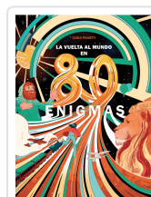
LA VUELTA AL MUNDO EN 80 ENIGMAS FRABETTI, CARLO