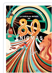
LA VUELTA AL MUNDO EN 80 ENIGMAS FRABETTI, CARLO