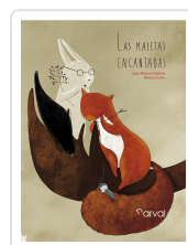
LAS MALETAS ENCANTADAS GISBERT, JOAN MANUEL