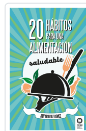
20 HÁBITOS PARA UNA ALIMENTACIÓN SALUDABLE RUÍZ GÓMEZ, AMPARO