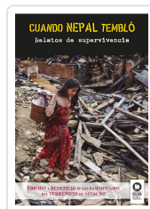
CUANDO NEPAL TEMBLÓ VARIOS AUTORES