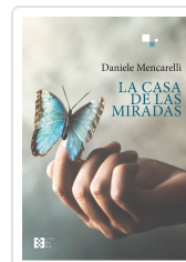
LA CASA DE LAS MIRADAS DANIELE MENCARELLI