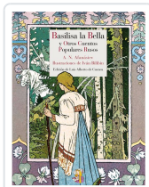
BASILISA LA BELLA Y OTROS CUENTOS POPULARES RUSOS AFANÁSIEV, ALEKSANDR NIKOLÁYEVICH