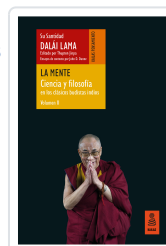
LA MENTE (CIENCIA Y FILOSOFÍA EN LOS CLÁSICOS BUDISTAS INDIOS, VOL. II) LAMA, DALÁI