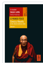
EL MUNDO FÍSICO (CIENCIA Y FILOSOFÍA EN LOS CLÁSICOS BUDISTAS INDIOS, VOL. 1) LAMA, DALÁI