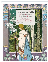
BASILISA LA BELLA Y OTROS CUENTOS POPULARES RUSOS AFANÁSIEV, ALEKSANDR NIKOLÁYEVICH