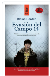
EVASIÓN DEL CAMPO 14 (5ª ED.) HARDEN, BLAINE