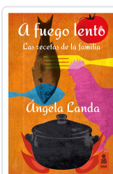
A FUEGO LENTO LANDA APARICIO, ÁNGELA