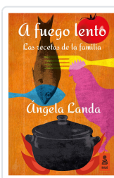
A FUEGO LENTO LANDA APARICIO, ÁNGELA