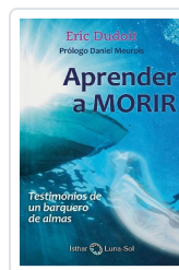
APRENDER A MORIR DUDOIT, ERIC