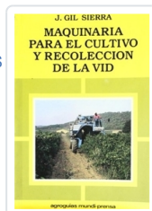
MAQUINARIA PARA EL CULTIVO Y RECOLECCIÓN DE LA VID GIL SIERRA, J.M.