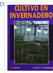
CULTIVO EN INVERNADERO ALPI, A.; TOGNONI, F.