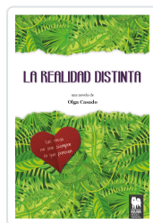
LA REALIDAD DISTINTA CASADO, OLGA