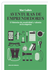
AVENTURAS DE EMPREENDEDORES GALTÉS CAMPS, MAR