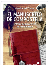
EL MANUSCRITO DE COMPOSTELA MIGUEL ÁNGEL VELASCO