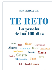
TE RETO. LA PRUEBA DE LOS 100 DÍAS AA.VV.