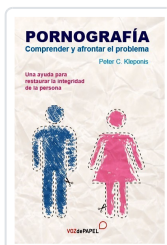
PORNOGRAFÍA. COMPRENDER Y AFRONTAR EL PROBLEMA PETER C. KLEPONIS