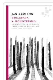
VIOLENCIA Y MONOTEÍSMO ASSMANN, JAN