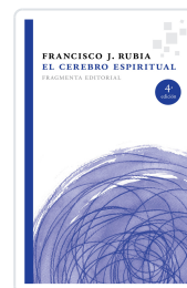
EL CEREBRO ESPIRITUAL RUBIA, FRANCISCO