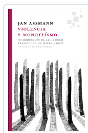
VIOLENCIA Y MONOTEÍSMO ASSMANN, JAN