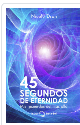
45 SEGUNDOS DE ETERNIDAD DRON, NICOLE