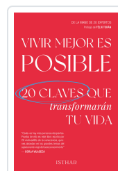
VIVIR MEJOR ES POSIBLE COAUTORÍA DE 20 AUTORES