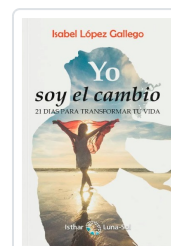
YO SOY EL CAMBIO LÓPEZ GALLEGU, ISABEL