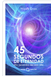
45 SEGUNDOS DE ETERNIDAD DRON, NICOLE