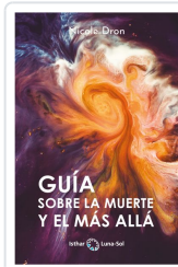
GUÍA SOBRE LA MUERTE Y EL MÁS ALLÁ DRON, NICOLE