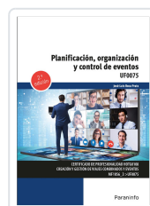
PLANIFICACIÓN, ORGANIZACIÓN Y CONTROL DE EVENTOS 2.ª EDICIÓN ROCA PRATS, JOSE LUIS