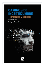
CAMINOS DE INCERTIDUMBRE PRADA, ALBINO