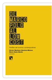
DE MARCO POLO AL LOW COST MARTÍNEZ SÁNCHEZ- MATEOS, HÉCTOR/RUBIO MARTÍN, MARÍA