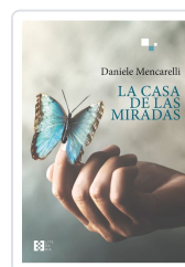
LA CASA DE LAS MIRADAS DANIELE MENCARELLI