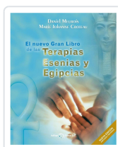
EL NUEVO GRAN LIBRO DE LAS TERAPIAS ESENIAS Y EGIPCIAS MEUROIS, DANIEL