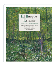
EL BOSQUE ERRANTE CASTRO MARTÍN, JUAN JOSÉ