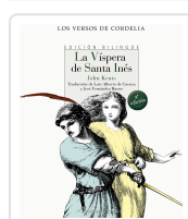
LA VÍSPERA DE SANTA INÉS KEATS, JOHN