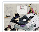
BARÓN BEAN GEORGE HERRIMAN