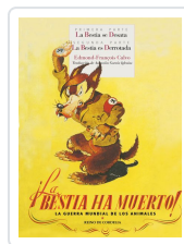
¡LA BESTIA HA MUERTO!