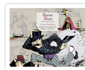
BARÓN BEAN GEORGE HERRIMAN