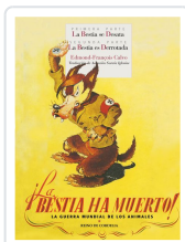
¡LA BESTIA HA MUERTO!