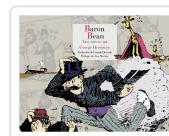
BARÓN BEAN GEORGE HERRIMAN