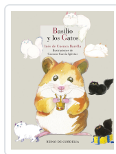
BASILIO Y LOS GATOS DE CUENCA BARELLA, INÉS; DE CUENCA Y PRADO, LUIS ALBERTO