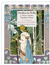
BASILISA LA BELLA Y OTROS CUENTOS POPULARES RUSOS AFANÁSIEV, ALEKSANDR NIKOLÁYEVICH