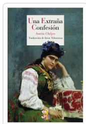
UNA EXTRAÑA CONFESIÓN CHÉJOV, ANTÓN