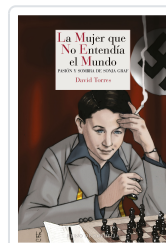
LA MUJER QUE NO ENTENDÍA EL MUNDO TORRES, DAVID