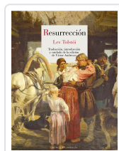
RESURRECCIÓN TOLSTÓI, LEV