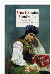
UNA EXTRAÑA CONFESIÓN CHÉJOV, ANTÓN